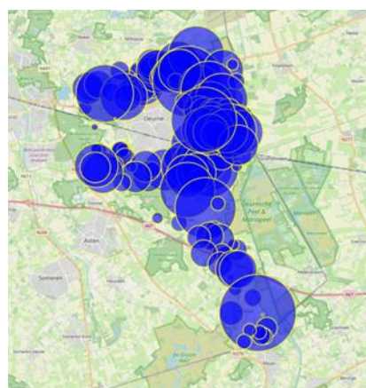
Varkensbedrijven in Deurne in 2022