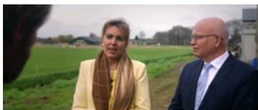
Uit: Zembla Stank en strijd deel 1 Minister Staghouwer (R) en staatssecretaris Heijnen op bezoek in Deurne

Als de gemeente ingrijpt in bestaande situaties, kan er sprake zijn van zogenaamde 'nadeelcompensatie'. Die moet de gemeente dan betalen aan de veehouder. In de pilot reikt de rijksoverheid Deurne daarbij de helpende hand.