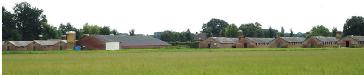
Stallencomplex in het buitengebied van Deurne

Op uitnodiging van Zembla, bezochten de toenmalige minister van landbouw en staatssecretaris Heijnen burgers, boeren en politici in Deurne. De uitzendingen (Stank en Strijd) hebben de staatssecretaris met de neus op de feiten gedrukt. Ze wil dit voorjaar in samenwerking met het gemeentebestuur van Deurne een pilot starten voor inzet van de Crisis- en Herstelwet.