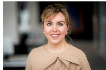
Staatssecretaris Heijnen (CDA) Infrastructuur en Waterstaat

De uitspraak van de rechtbank in Den Haag kan grote gevolgen hebben voor inwoners van gebieden met veel intensieve veehouderijen. Volgens een voorzichtige schatting zijn er in Nederland zeker 2000 adressen die te maken hebben met stankoverlast door de veehouderij van meer dan 19,4 odeur. De Wet Geurhinder Veehouderij (WGV) beschermt burgers onvoldoende. De overheid is daarvoor aansprakelijk. Saneren kan dus duur worden voor overheden (rijk, provincies, gemeenten.)