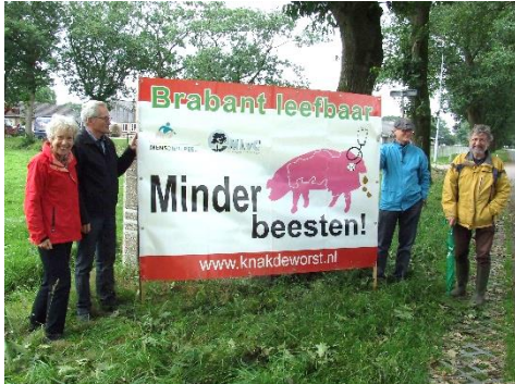
In actie tegen uitbreiding van de veestapel (2017)