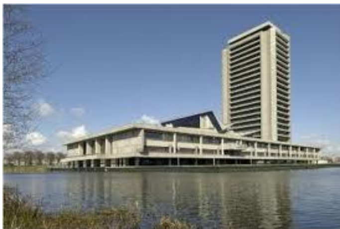
Provinciehuis 's-Hertogenbosch

Word lid van Stopdestank Meld u aan op stopdestank@gmail.com Contributie: 10 euro per jaar