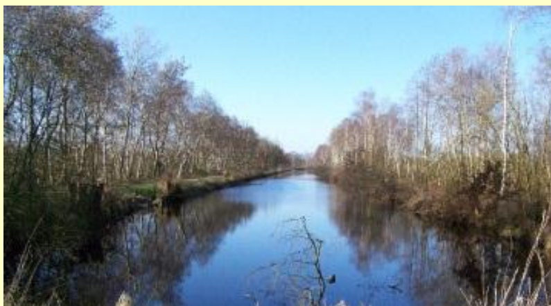
Deurnese Peel