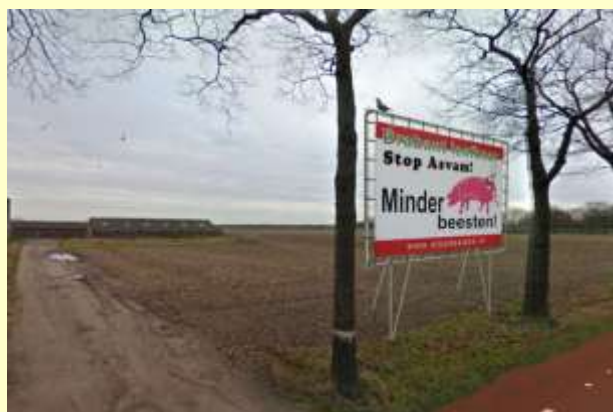
Geen Asvam aan de Snoertsebaan