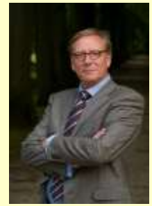
gedeputeerde de Boer