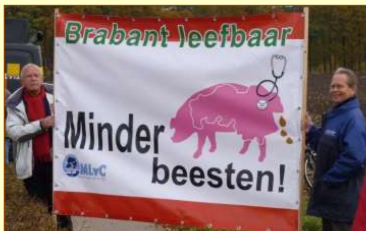
Evert en Henk in actie voor minder beesten

Soms moeten veehouders een vergunning hebben in het kader van de Natuurbeschermingswet. Het doel van deze wet is om waardevolle natuurgebieden in stand te houden. De Peel is een Europees erkend beschermd natuurgebied (Natura 2000-gebied). Om te beoordelen of een veehouder die meer dieren wil houden en/of meer ammoniak gaat uitstoten zo'n vergunning moet aanvragen, gaat werkgroep Behoud de Peel alle meldingen die bij de gemeente binnen komen opvragen en beoordelen. De werkgroep zal de gegevens aan ons doorsturen. Werkgroep Behoud de Peel: hartelijk dank!