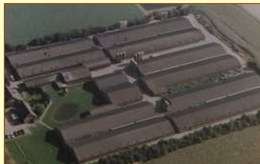
Steeds meer en steeds groter

De gezondheidsraad constateert dat omwonenden van veehouderijen zich vaak ongerust maken over hun gezondheid. Stankoverlast vermindert de kwaliteit van leven maar vaak brengen mensen stankoverlast ook in verband met gezondheidsklachten.