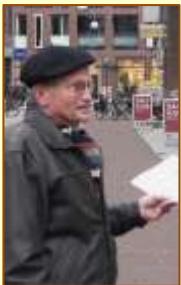
Handtekeningenactie 22 dec 2012