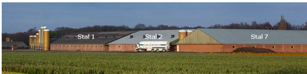
De bulkwagen geeft een indruk van de grootte van enkele bestaande stallen