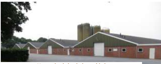
Verstening in het buitengebied

De rijksoverheid vraagt gemeente en provincies om niet mee te werken aan de wijziging van een bestemmingsplan als een bedrijf daardoor meer dan 6000 varkens kan houden: de 'Bleekernorm'. (uit: Boerderij, maart 2012). Swipigs wil 12.500 varkens gaan houden. Dat is ruim het dubbele. Toch stelt College van B. en W. de gemeenteraad voor om voor Swipigs het bestemmingsplan buitengebied te wijzigen!