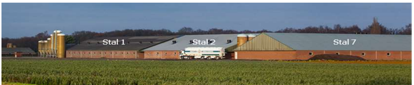
De bulkwagen geeft een indruk van de grootte van enkele al bestaande stallen

Deze ledenbrief gaat over Swipigs. Dit bedrijf aan de Hoogdonkseweg in Liessel overschrijdt al jaren de geurnormen. De gemeente treedt niet op. Sterker nog: het College wil Swipigs een vergunning verlenen voor de bouw van een nieuwe stal. Een stal voor 4000 varkens. Een stal met een oppervlakte groter dan een voetbalveld en met een hoogte van 12 meter.