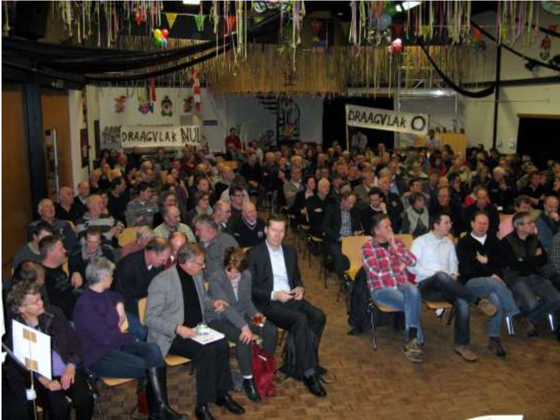
Protestbijeenkomst tegen de plannen van Asvam in maart 2013

Er komen geen 17.000 varkens aan de Snoertsebaan; de provincie verkoopt de grond niet aan Asvam. Omwonenden voerden samen met Stopdestank actie. Het provinciebestuur heeft naar de mensen geluisterd. Maar het gemeentebestuur van Deurne niet. Het college is van plan om vier bedrijven in die buurt vergunningen te verlenen voor uitbreiding met in totaal meer dan 10.000 beesten.