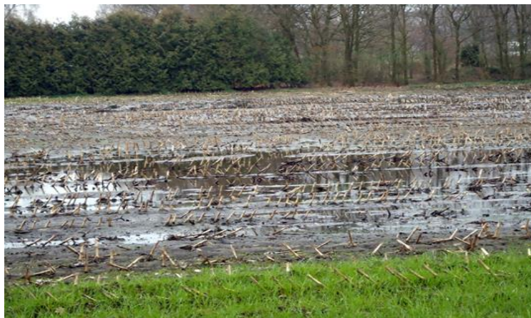
Maisplak in Deurne.....en het heeft al dagen niet geregend!

De meeste mensen zullen wel met een boer in hun buurt willen praten. Maar welke burger in het buitengebied is blij met de komst van nog meer beesten? Als ze merken dat de boer hun bezwaren naast zich neerlegt en zijn plannen toch doorzet, is de kans groot dat de dialoog eindigt in knallende ruzie. Dan leidt dialoog niet tot meer begrip maar tot oorlog op het platteland.