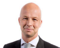
Tjeerd de Groot D66