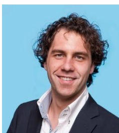
Martijn van Dam Staatssecretaris landbouw