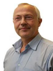
Ignas van Bebber Arts