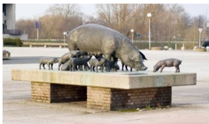
kunstwerk vóór provinciehuis geschonken door boerenorganisatie NCB

Op 23 juni jl. was er een openbare commissievergadering van Provinciale Staten over de voorstellen waarover onze volksvertegenwoordigers op vrijdag 7 juli as. een beslissing nemen (zie blz. 1). Een delegatie van bewonersgroepen en milieu-organisaties woonden de vergadering bij. Boeren hadden massaal gevolg gegeven aan de oproep van ZLTO om naar het provinciehuis te komen. Op volgorde van aanmelding kregen 20 mensen gelegenheid om het woord te voeren.