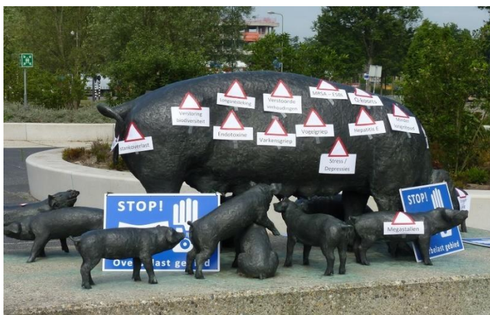
Protest van Brabantse bewoners- en milieugroepen bij het provinciehuis

Veel boeren en hun organisaties protesteerden afgelopen maanden fel. Politici stonden onder zware druk. Toch hielden veel volksvertegenwoordigers hun rug recht. VVD, D66, SP, PvdA en Groen-Links stemden vóór een stop op de groei. CDA en PVV stemden tégen , evenals de kleinere partijen (50plus, ChristenUnie / SGP en Lokaal Brabant). De Partij voor de Dieren vindt dat de plannen niet ver genoeg gaan en stemde daarom tegen. De voorstellen werden aangenomen met 32 Statenleden voor en 22 Statenleden tegen.