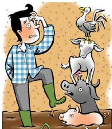
Sandra de Haan

Als veehouders in Brabant alle verleende vergunningen invullen, groeit de intensieve veehouderij in BRABANT met 800.000 varkens, ruim 16 miljoen stuks pluimvee, ruim 500.000 runderen, 58.000 geiten, 20.000 schapen, 66.000 nertsen en 190.000 konijnen. Dat blijkt uit publicaties van Mens, Dier & Peel. Voor DEURNE zou dat een groei betekenen van bijna 45 duizend varkens, 1½ miljoen stuks pluimvee en ruim 23 duizend runderen.