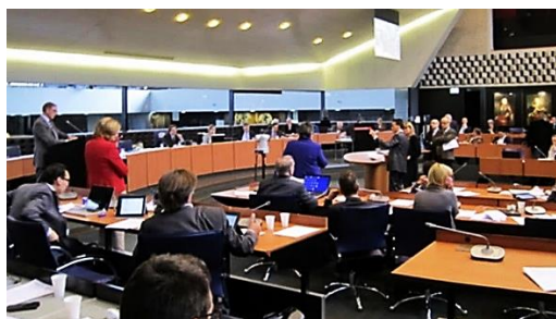
Vergadering Provinciale Staten

De natuur kent geen medelijden; de natuur kent enkel gevolgen. Houd uw rug recht en neem uw verantwoordelijkheid. U bent gewaarschuwd; indringend gewaarschuwd. U zult nooit kunnen zeggen: ik heb het niet geweten!