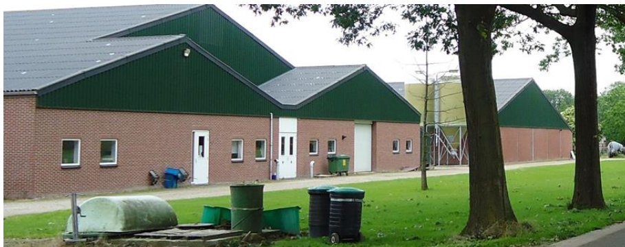
Stallen in het buitengebied van Deurne

Omwonenden hebben een jurist in de arm genomen.